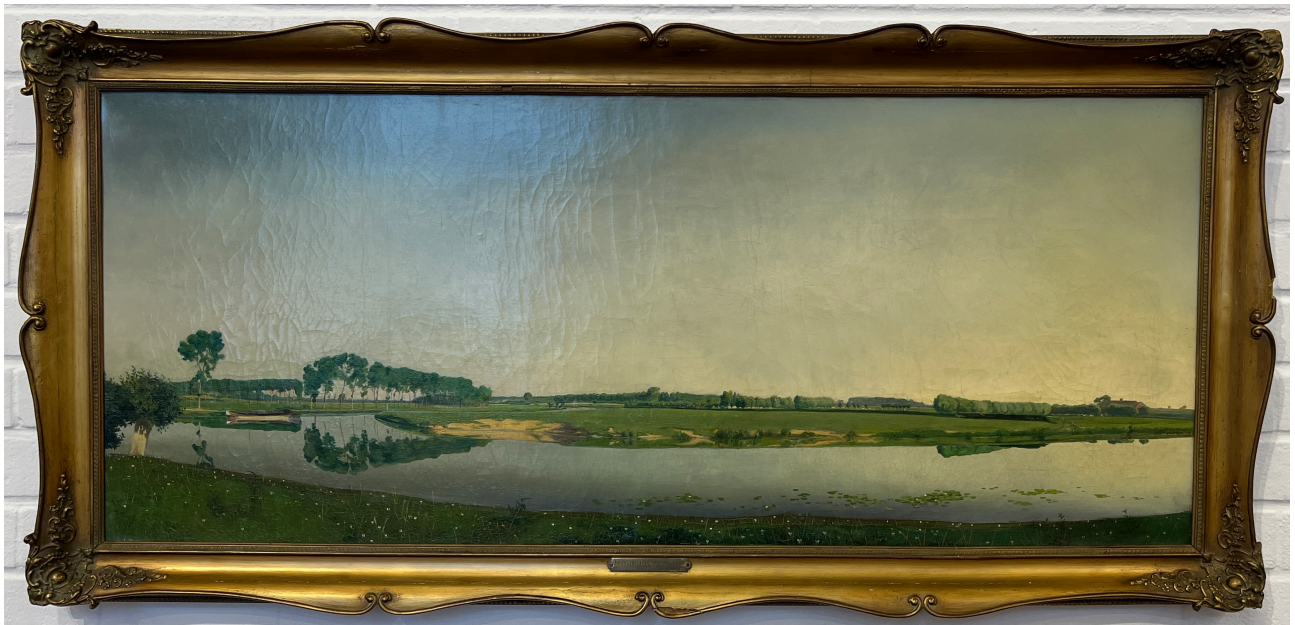
Valerius de Saedeleer , un de mes favoris