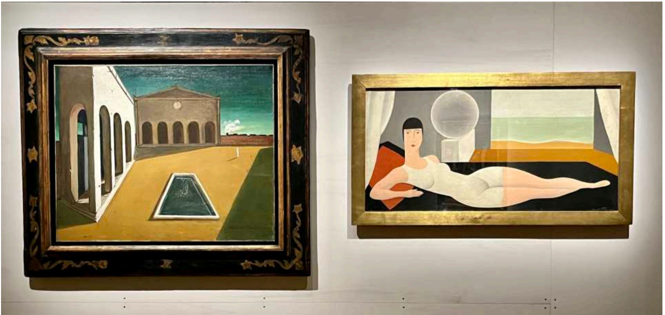
De Chirico et Magritte et Magritte