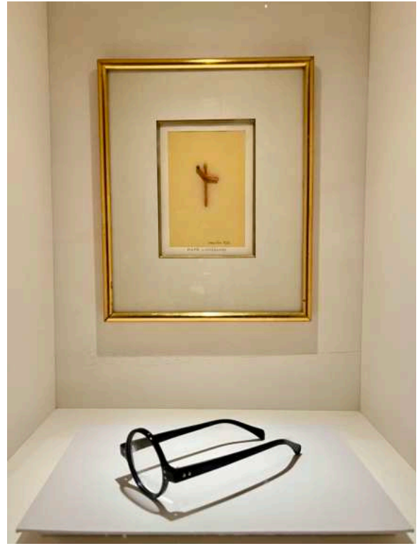
Marcel Mariën et Magritte