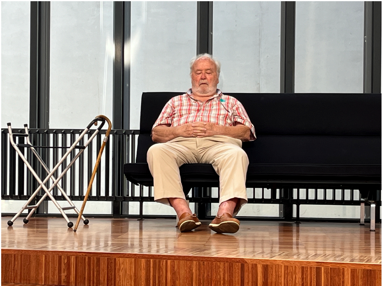
Anish Kapoor fatigue le visiteur.