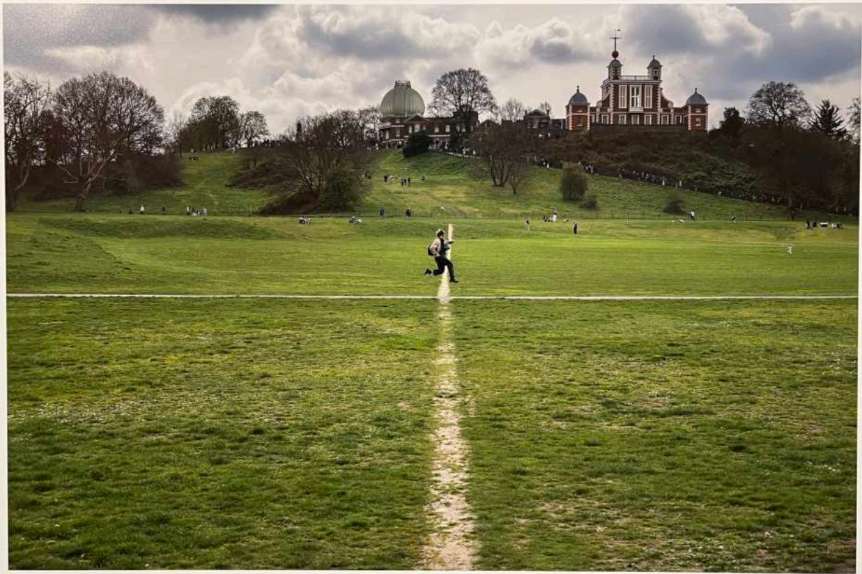
Londres, Greenwich, dimanche de Pâques 2023 Louis saute par-dessus le méridien.

L'allée de hêtres a été plantée en 1775 comme voie d'accès à une maison de campagne aujourd'hui abandonnée. La forme originale des arbres est l'œuvre du propriétaire d'origine James Stuart. Il a planté les hêtres étroitement, tissé leurs branches et taillé les arbres pour qu'ils forment un tunnel ensemble. Sur les 150 arbres, il restait 90 en 2023. Les hêtres ne vieillissent pas beaucoup plus de 250 ans.