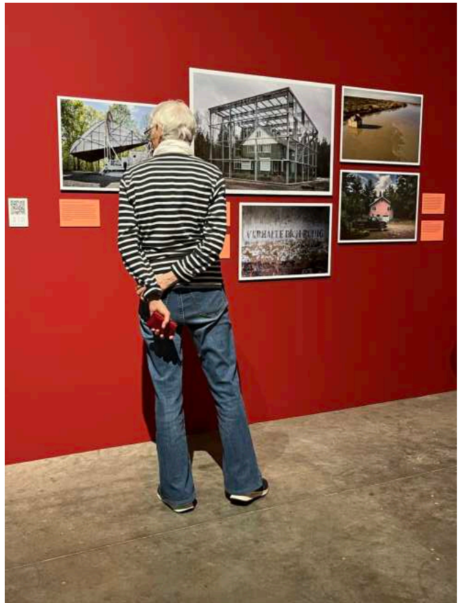
Vescona Chiesa, Sienne, juillet 2015

La Crete Senesi est une région agricole vallonnée au sud-est de Sienne, au cœur de la Toscane. Les cyprès ont été plantés stratégiquement le long des routes, des sentiers et des terres pour indiquer les limites de propriété.