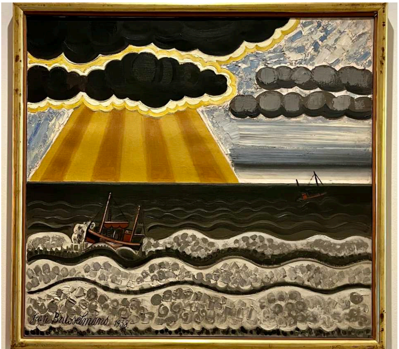
Brusselmans, notre tableau préféré et Michel Van Cuyck. Page suivante: détail de dames en crinolines sur la plage.