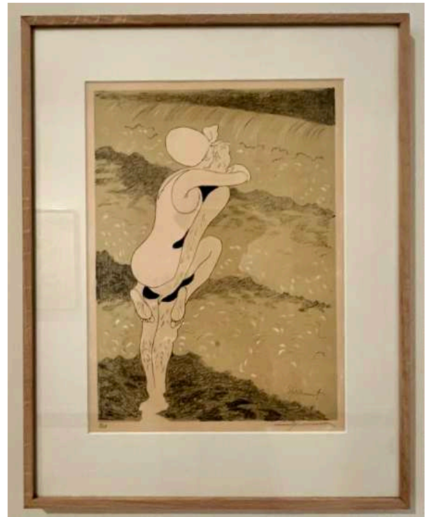
Léon Spilliaert, un autre favori.