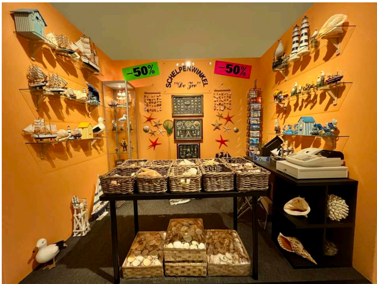
Guillaume Bijl, « La boutique aux coquillages ».