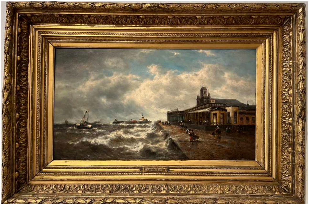
Ci-dessous Constantin Meunier.