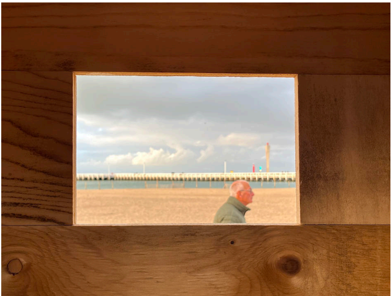
Dans le sable de la petite plage, les photos sont présentées sur des panneaux en bois. Une découpe dans une planche laisse voir l'estacade. Un homme passe, la photo est de moi.