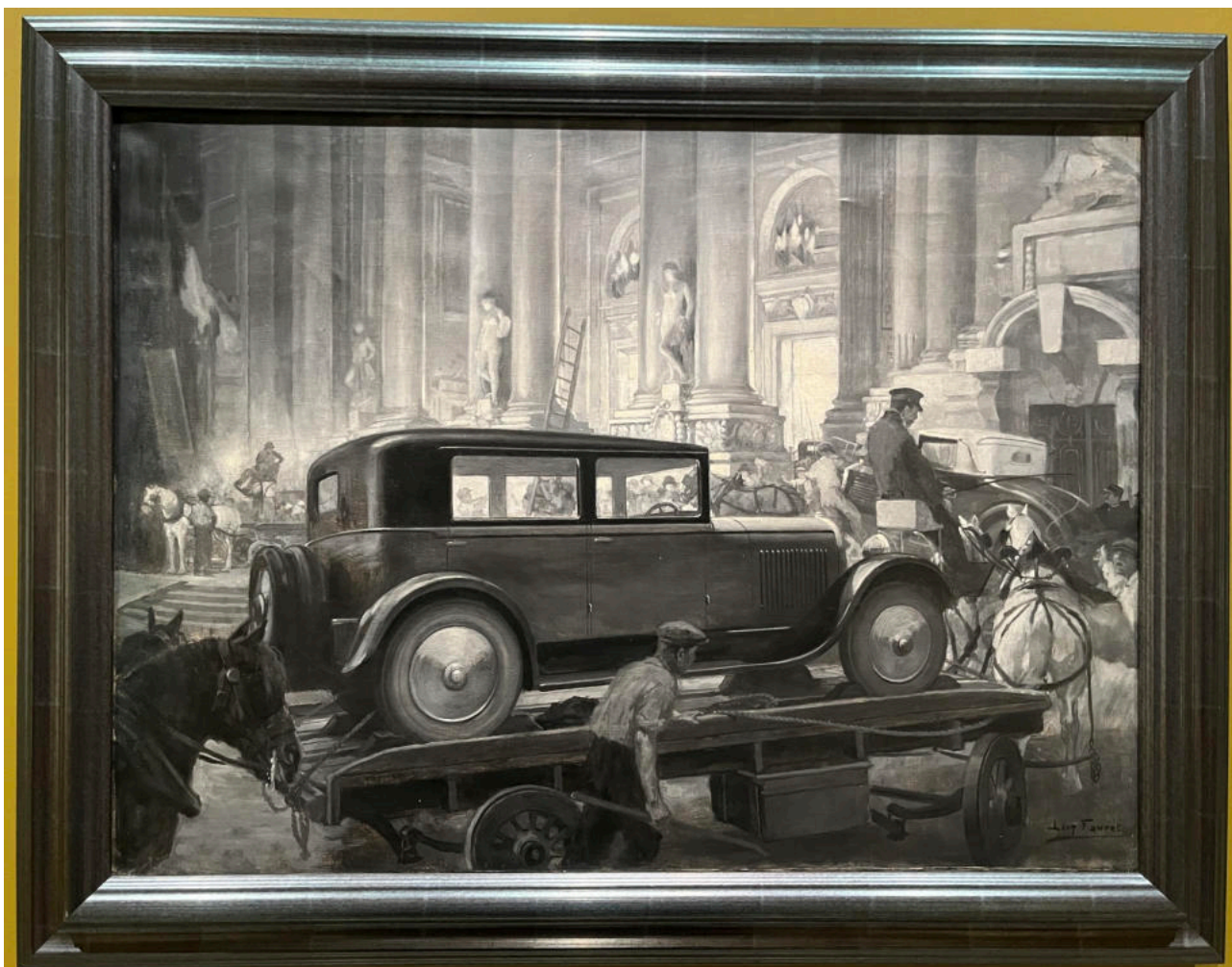
1930 - Livraison de voitures au Salon de l'automobile, Grand Palais. 1934 - Zone de Saint-Ouen