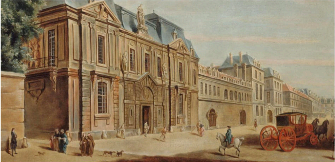
Westermann (d'après Raguenet), L'hôtel Carnavalet vers 1740, 1926

Carnavalet est le musée de l'histoire de Paris. Une exposition temporaire retrace la ville dans les années 30.